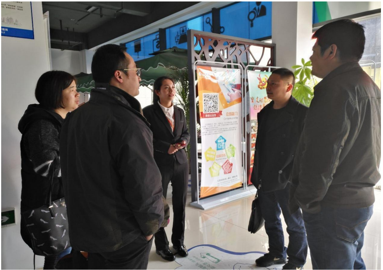
14. 2017年3月15日塘巢创客空间与塘汇街道以及各社区工作人员共同携带塘汇实验学校开展3.5学雷锋活动。